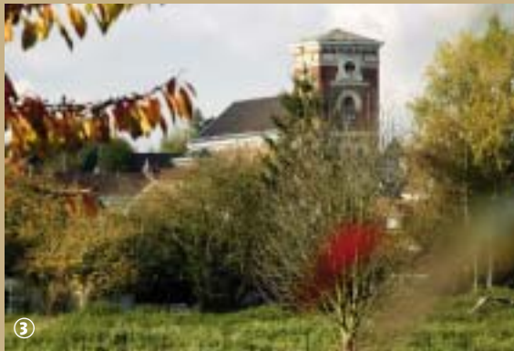
La campagne à deux pas des agglomérations

Saviez-vous que l'église Saint Martin d'Aulnoy-lez-Valenciennes renferme, dans un habitacle situé au fond de l'édifice, une œuvre donnant lieu à un pèlerinage fort ancien ?